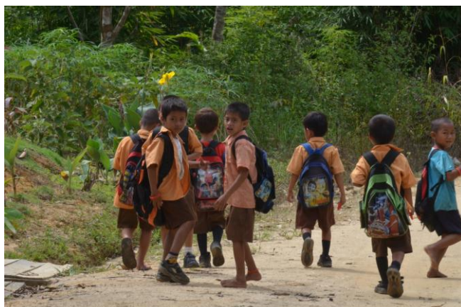
Weer langzaam terug naar huis !